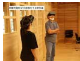
3, 林業労働安全VR体験