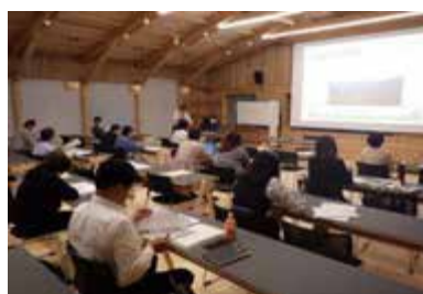
6月2日アカデミー棟会場の様子