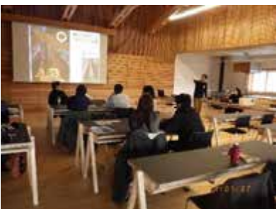
1, 森林・林業の基礎講座