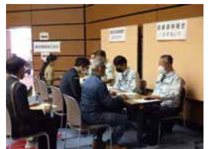
森林の仕事ガイダンス(東海3県合同)