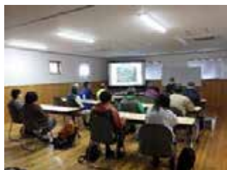
第1回森林・林業の講義