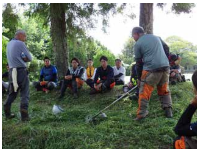
「緑の雇用」事業 フォレストワーカー研修の様子