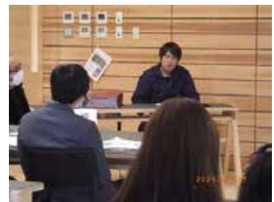
3, 森林組合の仕事のお話