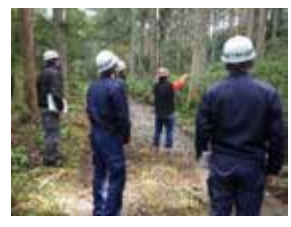
4, 速水林業山林見学