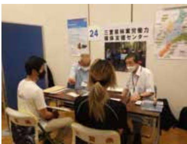
三重県農林漁業就業就職フェア2023(共催)