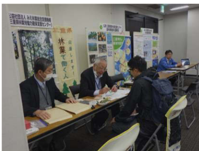
三重県移住フェアin大阪2023