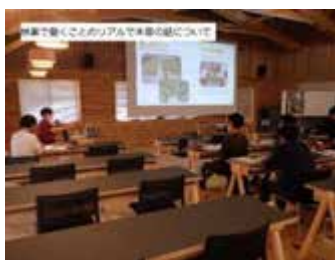
2, 林業で働くリアルで本音の話