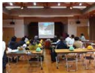
第2回森林・林業の講義