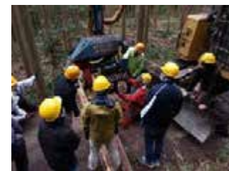
プロセッサの説明