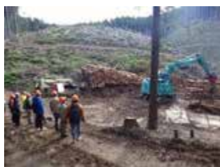
グラップルの操作体験