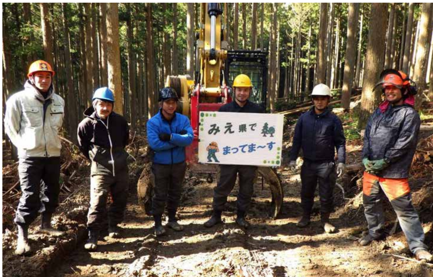
県外からU・I・Jターン就業PR（ご協力：令和4年度FW修了生の皆さん）