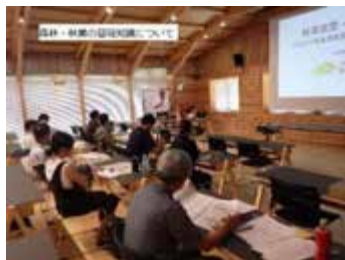
1, 森林・林業の基礎知識