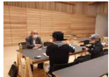
6月2日個別相談会の様子