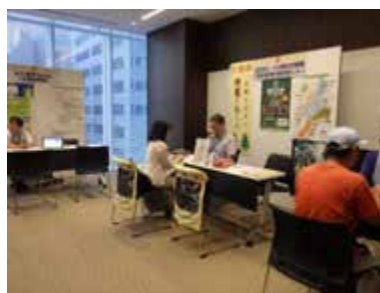
三重県移住フェアin名古屋2023